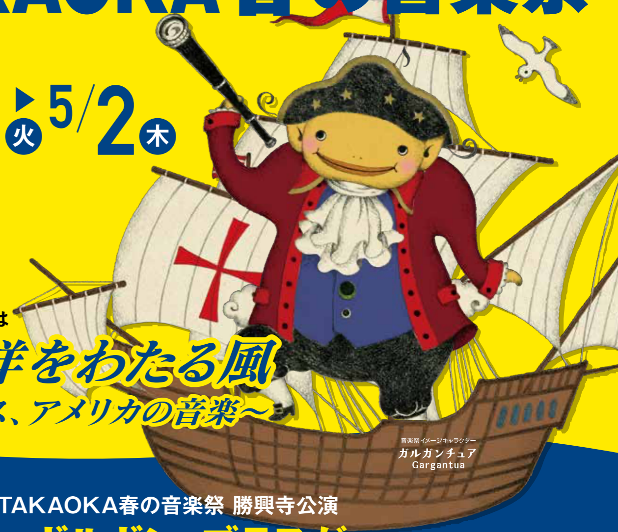
音楽祭イメージキャラクター ガルガンチュア Gargantua